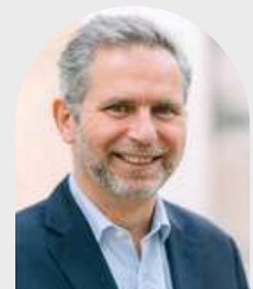
Antoine de FLEURIEU