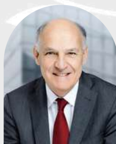
Pierre-André de CHALENDAR