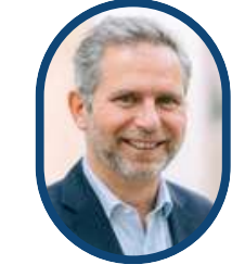
Antoine de FLEURIEU