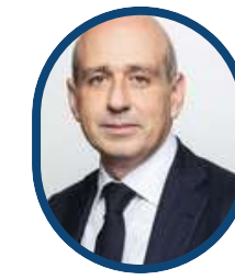
Antoine de FLEURIEU